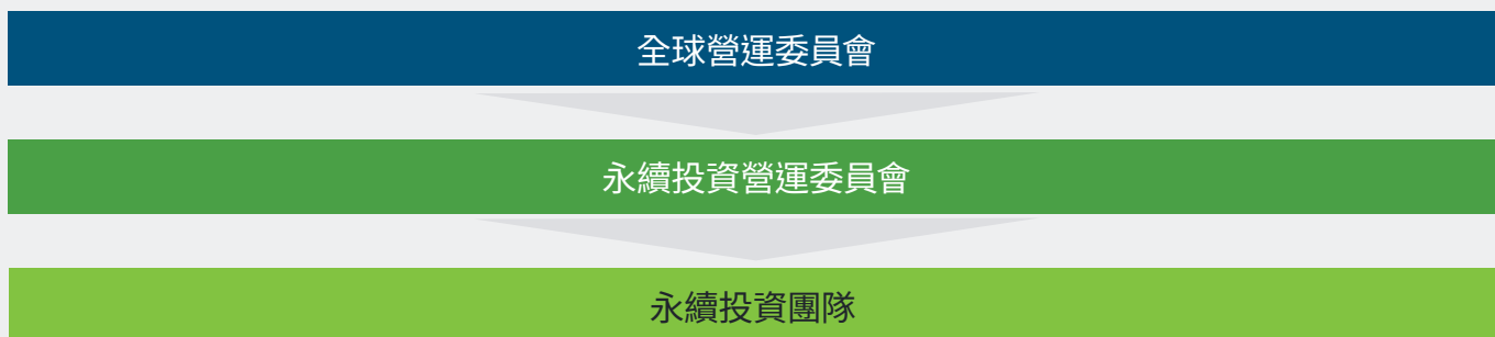
圖1：永續投資營運委員會

而在適當情況下，我們傾向以負責管理這些資產的實體所訂股東參與政策為依據。我們對我們委託機構的政策進行初步審查，包括與參與政策有關的規定，並在與該機構進行盡職調查時監督這些政策的實施狀況。