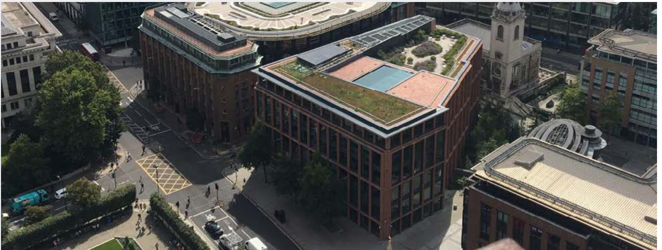
富達國際在CannonStreet的辦公室。

FIL Limited和其他Fidelity命名的公司聯繫我們時，請注意FIL Limited（富達國際）、我們的組織及其子公司和附屬公司是獨立於Fidelity Investments/Fidelity Management and Research Company (FMR) 和Fidelity Institutional Asset Management (FIAM)的獨立公司，統稱為富達資產管理(FAM)，其他具有相似名稱的組織亦然。我們設有嚴格的資訊屏障，以確保敏感的投資和投票數據不得於 FIL Limited和FAM的投資專業人士之間共享交流。